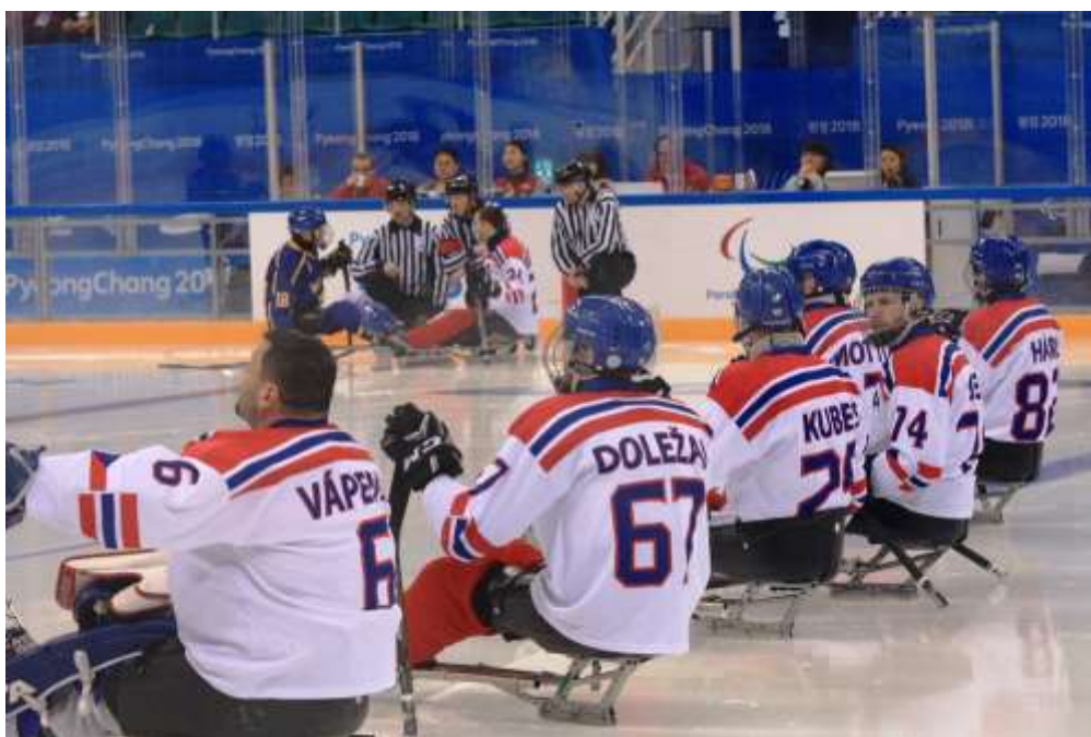
Český tým sledge hokejistů v souboji se Švédy na ZPH 2018 v PyeongChangu (6. místo)