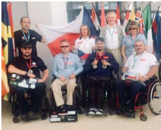
Český tým střelců slaví obrovské úspěchy na SP Chateauroux (FRA) 2018