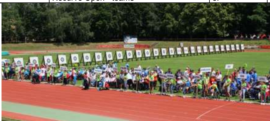
Úvodní ceremoniál při lukostřeleckém WRT v Novém Městě nad Metují 2018